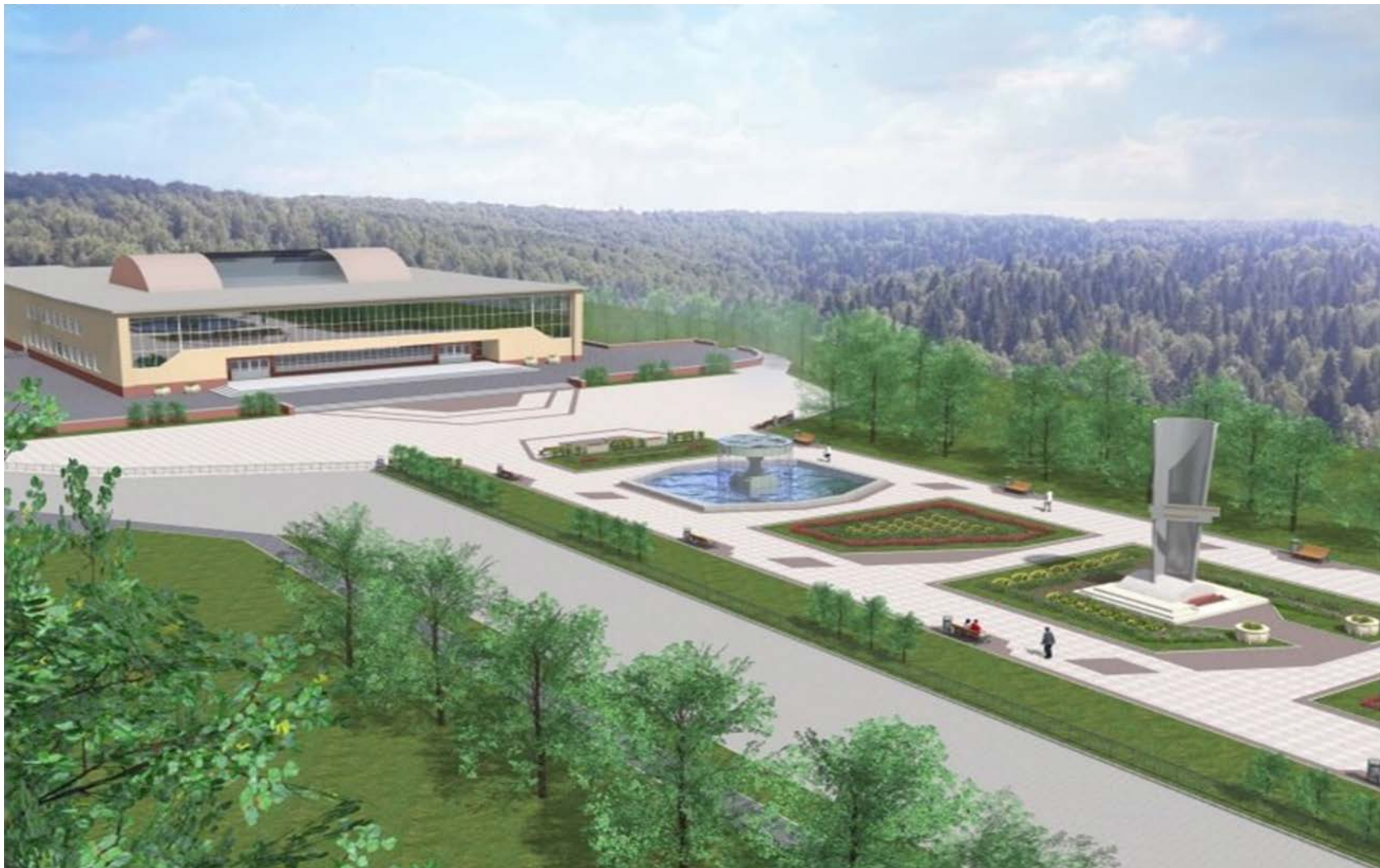
Вид № 2