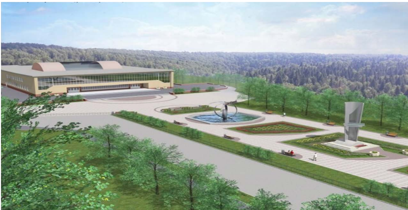
Вид № 1