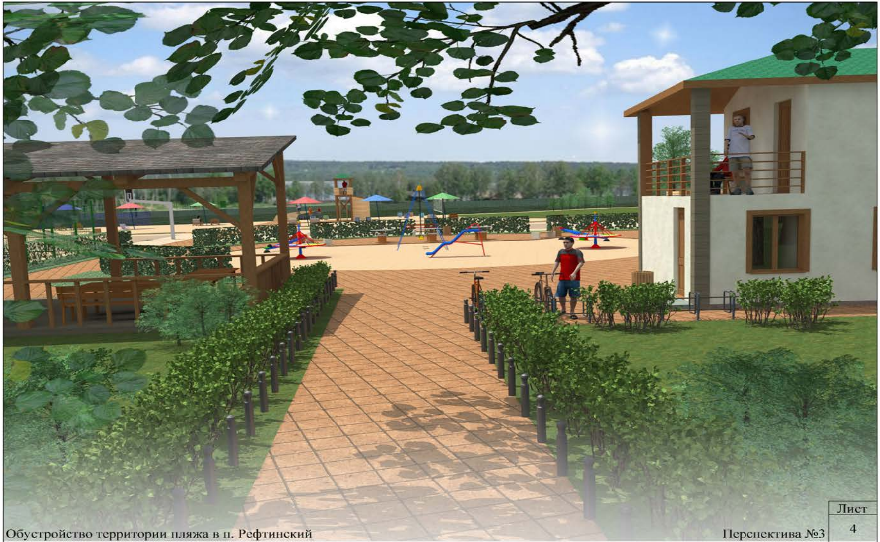
Вид № 3