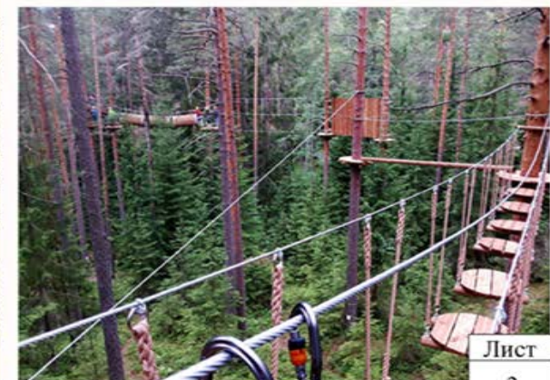
Обустройство территории в районе Дома торговли в п. Рефтинский (канатный парк)

Канатные парки представляют собой комплекс с различными аттракционами, которые размещаются над землей на разной высоте. Каждый посетитель может почувствовать себя в таком парке альпинистом, скалолазом и просто ловким человеком. Есть три этапа прохождения. Они включают в себя элементы подъема, перемещения на высоте, а также элементы спуска. Этапы соединены между собой логической цепочкой. Канатный парк может иметь разную протяженность. Но обычно от пятидесяти до четырехсот метров. На прохождение всего маршрута участник может потратить от пятнадцати и до тридцати минут.